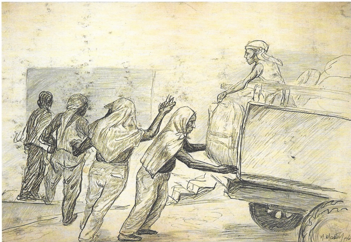
Cargadores de Xallitic

o David Alfaro Siqueiros –entre algunos miembros de la célula “José Revueltas”– o de los pintores de este partido político. Otros de sus amigos-maestros-colegas fueron diversos muralistas de Ciudad Universitaria: Juan O’Gorman, Pablo O’Higgins, Chávez Morado y Jorge González Camarena, bajo la convergencia de sus intereses plásticos, cuando en 1953 era inaugurada esa urbe magna de la Universidad Nacional Autónoma de México.